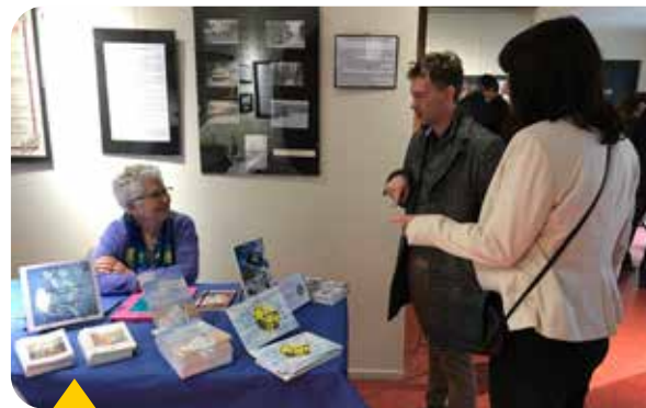
Salon du livre

Organisé par le Cercle Beaumontois du Patrimoine et remise des prix du concours de nouvelles en partenariat avec le Lions club Beaumont-l'Isle-Adam, dimanche 1 er décembre