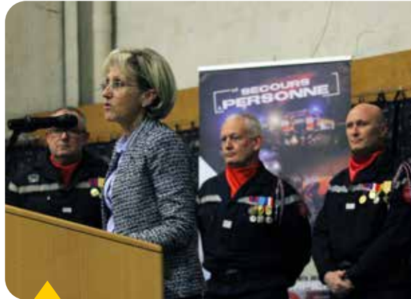
Cérémonie de passation de commandement au centre de secours des sapeurs pompiers, vendredi 8 novembre