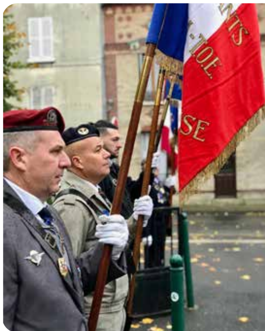
Cérémonie de commémoration du 11 novembre 1918