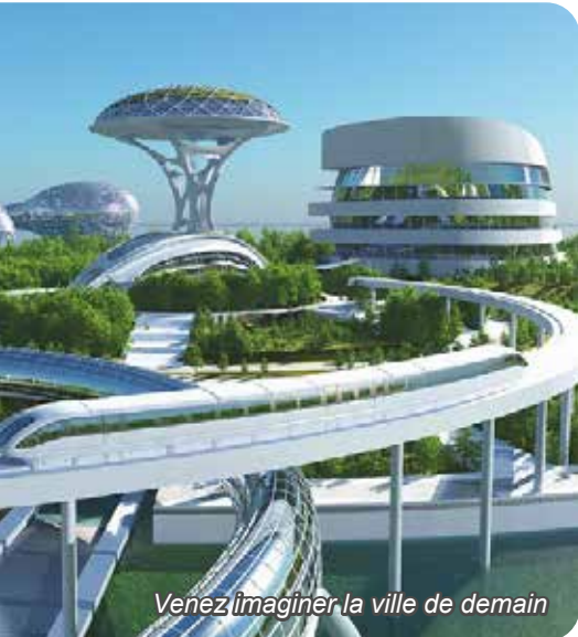
Venez imaginer la ville de demain

LA MAIRIE, SES PARTENAIRES ET LE CERCLE BEAUMONTOIS DU PATRIMOINE VOUS CONVIENT À UN ATELIER PÉDAGOGIQUE ÉLARGI POUR UNE ANIMATION LUDIQUE AUTOUR DE L'ÉCO-CITOYENNETÉ : LE RECYCL'DÉFI