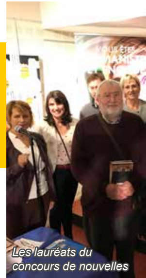
Les lauréats du concours de nouvelles

Organisé par le Cercle Beaumontois du Patrimoine et remise des prix du concours de nouvelles en partenariat avec le Lions club Beaumont-l'Isle-Adam, dimanche 1 er décembre