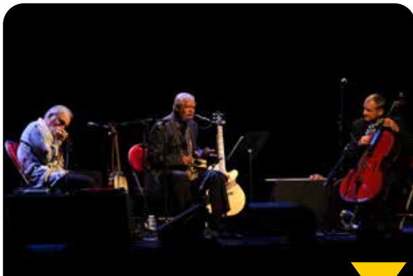
Concert de Crossborder Blues pour le festival Jazz au fil de l'Oise, dimanche 24 novembre