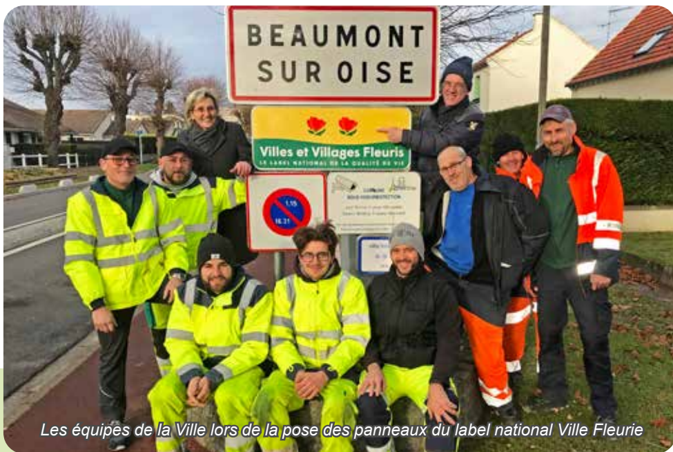
Les équipes de la Ville lors de la pose des panneaux du label national Ville Fleurie

Des atouts qui n'ont pas échappé au jury du label national lors de sa visite en juillet dernier, dessinant une thématique allant de l'harmonie des espaces verts aux initiatives éco-citoyennes, le tout au service du bien-vivre ensemble.