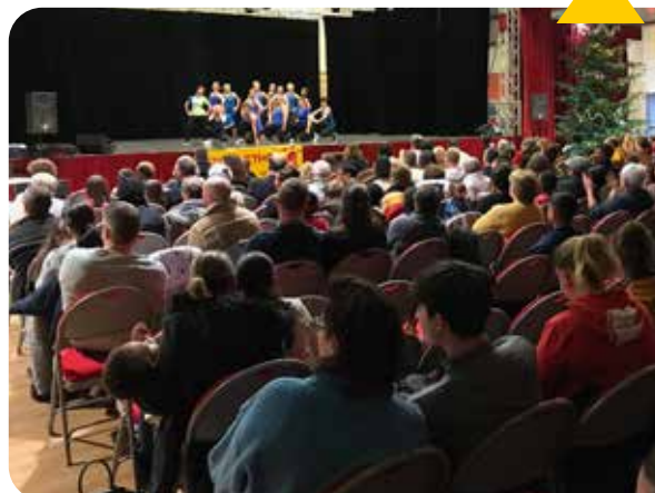
Téléthon avec Agir Ensemble 95, les 6, 7 et 8 décembre 6 000€ récoltés pour la bonne cause